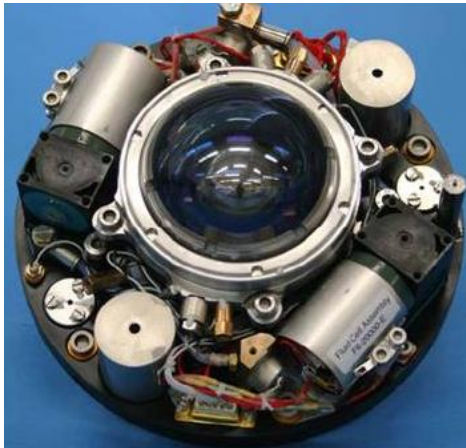
Equipo de vuelo del experimento GeoFlow

la experimentación en plataformas espaciales los resultados de las investigaciones, así como darlo a conocer al público en general”.