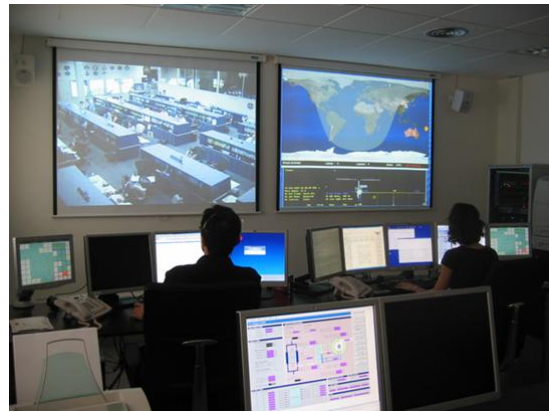
Sala de control del E-USOC

17 entidades de 12 países europeos están implicados en este proyecto, coordinados por el investigador italiano Luigi Carotenuto. ULISSE responde a la expresión “USOCs KnowLededge Integration and Dissemination for Space Science and Exploration”, es decir, integrar el conocimiento de una red de centros operativos en la experimentación espacial: los denominados USOCs, que dependen de la Agencia Espacial Europea (ESA).